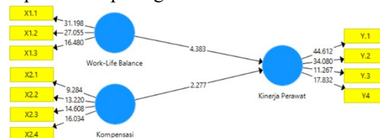
Gambar 2 (Output PLS Bootstrapping)

Model ini dievaluasi dengan melihat r-square (reliabilitas indikator) untuk konstruk endogen dan nilai t-statistic dari pengujian koefisien jalur ( path coefficient ) untuk uji signifikan antar konstruk. Jika nilai r-square semakin tinggi maka dapat dikatakan semakin baik pula model penelitian yang diajukan. Tingkat signifikan dalam pengujian hipotesis adalah nilai path coefficient . Model struktural ( inner model ) dapat dilihat pada gambar berikut: